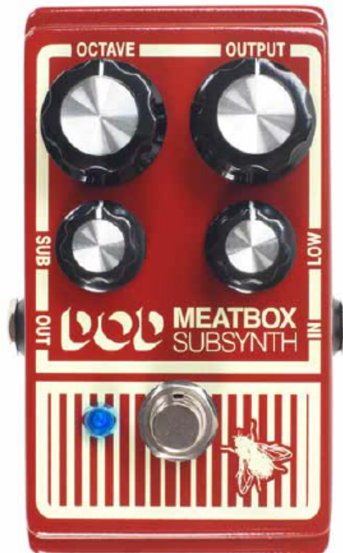
DOD MEATBOX SUBSYNTH [FRA]