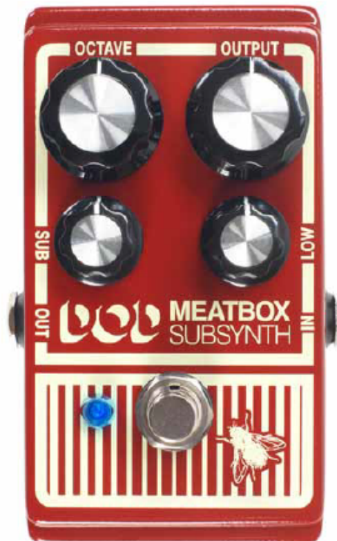
DOD MEATBOX SUBSYNTH [ESP]