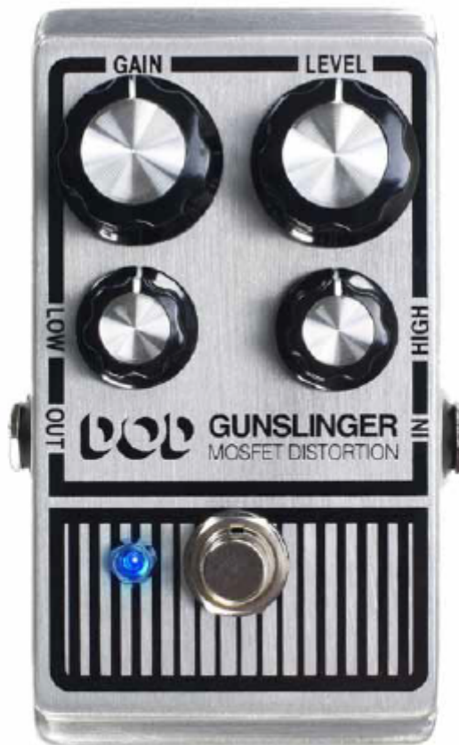
DOD GUNSLINGER MOSFET DISTORTION [DEU]