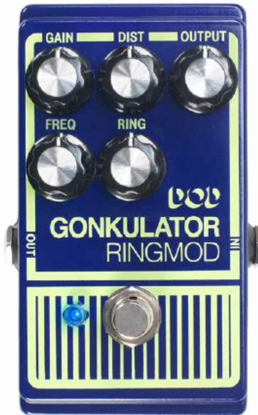
DOD GONKULATOR RINGMOD [SVN]