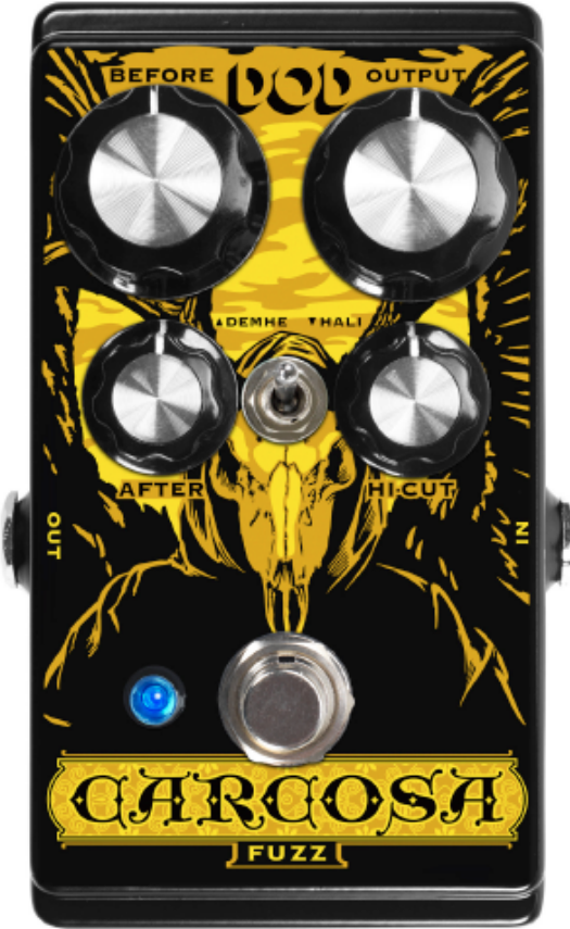
DOD CARCOSA FUZZ [HRV]